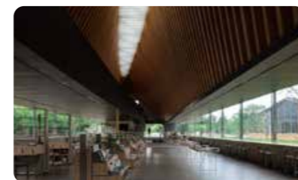
表皮与空间 - 金属复合材料展区