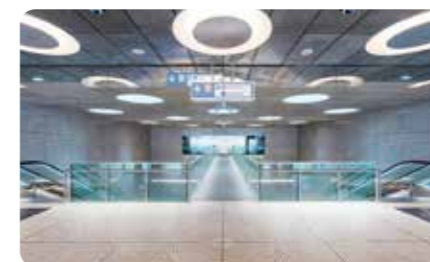
砼饰界 - 建筑/景观艺术混凝土展区