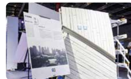
Facade LAB 20—幕墙20问