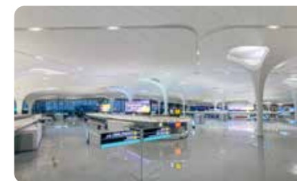
建筑的温度 - 保温隔热展区