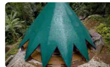
瓷境·碳索 - 陶瓷绿色高质量发展展区