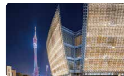
构造 - 竹木建筑之美主题展区