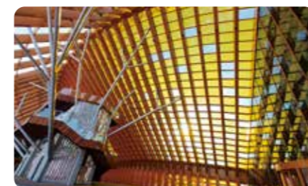
BIPV建筑光伏一体化展区